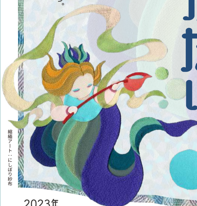
縮緬アートにしほり紗布

今回のユースシアターでは、 近江の昔話をいつまでも残したいと思い、 ミュージカルにしました。 県内の小学生から大学生までの26人が、 どこか懐かしい言葉とメロディーで演じます。