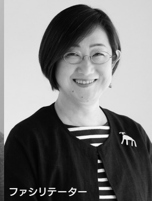
ファシリテーター

（公）びわ湖芸術文化財団理事（2025年度～）。兵庫県豊岡市立城崎国際アートセンター館長（21年度～）。90～07年度伊丹市立演劇ホール（アイホール）プロデューサー。00～07年度びわ湖ホール夏のフェスティバルプログラムディレクター。03～05年度京都造形芸術大学舞台芸術研究センタープロデューサー。04～17年度（一財）地域創造／公共ホール現代ダンス活性化事業コーディネイター。05～09年度大阪大学コミュニケーションデザイン・センター特任教授。93年度～岩下徹即興ダンス制作。05年度～神経難病ALS発症の友人の24時間他人介護による独居生活＜ALS-Dプロジェクト＞コーディネイト。介護福祉士。能囃子幸流小鼓、観世流謡・仕舞稽古中。